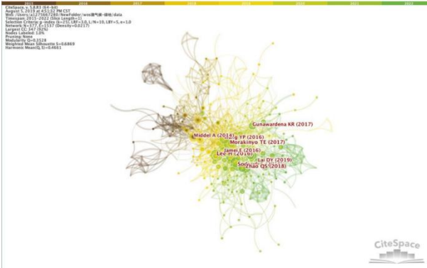
图 3 城市绿地视角下微气候研究作者共被引图