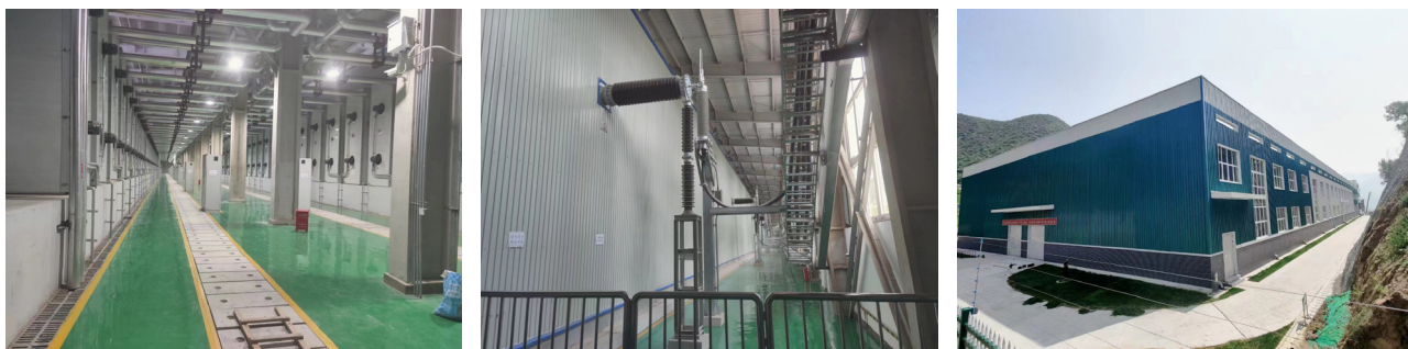
图 3 分布式变频系统