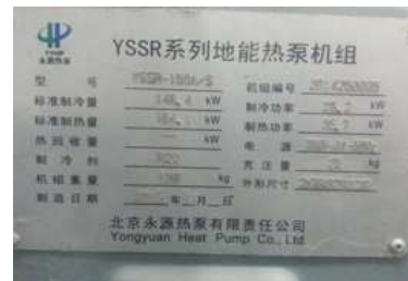
图 2 地源热泵铭牌

根据以上研究，确定选用两台 YSSR-150A 地源热泵机组满足建筑冬季供暖和夏季制冷的需求。具体优化改造选用的地源热泵参数如图 2 铭牌所示。