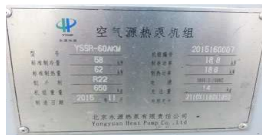
图 3 空气源热泵铭牌

根据以上研究，确定选用 5 台 YSSR-60AKM 空气源热泵机组满足建筑冬季供暖和夏季制冷的备用需求。具体优化改造选用的空气源热泵参数如图 3 铭牌所示。