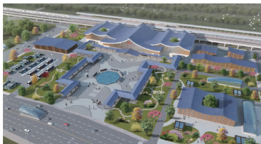
图3 武进站站前广场景观效果图

文化解析：武进为古常州府府治所在，三皇五帝的舜在这里农耕，春秋三让君位的季札在此食邑，忠肝义胆伍子胥从这里入吴，江东八千子弟跟随项王逐鹿中原，两汉三国威震天下的丹杨兵从这里走出，齐梁两朝的帝王之乡，隋唐五代的天宁宝刹，宋元明清的进士宝地、状元之乡，以及淞沪会战的抗日英雄王庚、做过中国共产党总书记的瞿秋白、领导南昌起义的张太雷、黄埔四期政治教官恽代英都是这片土地上孕育的，真可谓人杰地灵，连宋代大文豪苏轼都把这里作为自己终老之地。这里也是宫梳名篦的故乡，中国近代轻纺工业的摇篮，更是通衢要道，联结南来北往，西去东来的重镇，著名的水门——通吴门就在这里。（图3）