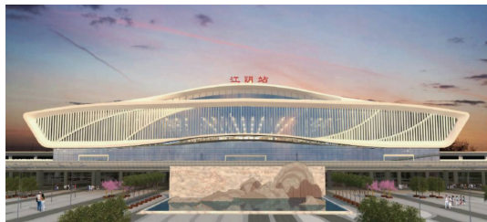
图4 江阴站站前广场景观效果图

江阴同样人杰地灵，在整个历史长河中有着重要的历史地位，近代有三钱、三刘，都是文学界、科学界的佼佼者。苏锡常地区为环太湖地区，这里是吴文化的中心区域，吴人舍生取义，轻生赴死的精神同样在江阴人身上能够得到体现。远者徐霞客，敢为人先，独自出游跋山涉水，为我国的旅游界、地质界作出重大贡献，同时他为了完成朋友的嘱托，不辞辛劳不畏艰苦，不惧危险完成这个诺言，最终付出了自己的健康和生命。近者新中国的华西村，同样敢为人先的引领改革开放新浪潮，写下保证书，按下拇指印，最后江阴成为富县之一，当年的承诺全部兑现。（如图4）