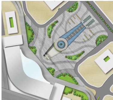
图2 金坛站站前广场平面景观效果图

文化解析：金坛素有江东福地之称，人杰地灵，代有才出，且多有杰出之文人，举世之傲骨，唐代储光茜、戴叔伦，为颇有影响的大诗人，宋代张纲、刘宰为官清正，多有丰富著作，明代王肯堂所著《证治准绳》至今仍为中医基础教材，更有文学训诂学巨匠段玉裁和世界著名数学家华罗庚享誉崇高，影响深远。（如图2）