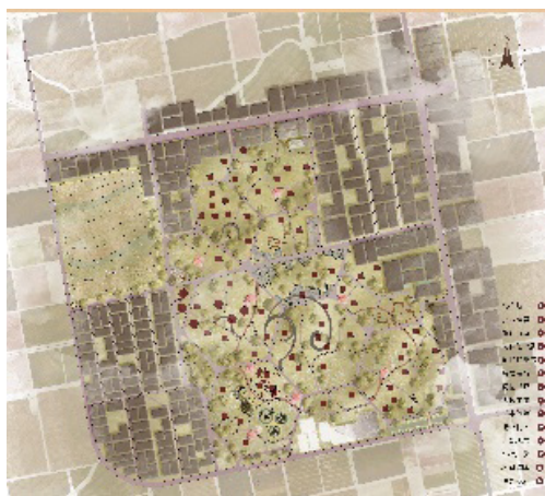
图 2 场地平面图

研究区域再设计的主要人口空间为区域内东西走向的柏南村道。两端经过狭长的人口空间到达地坑窑群落地区。对路网进行划分，重新规划功能区域，增加地上空间的层次感，设置天桥区域，结合休闲娱乐区，丰富村落景观的视觉体验。地下空间以建筑为主，打造全新的活动场所，满足居民的对地下窑居空间的需求（见图 2）。