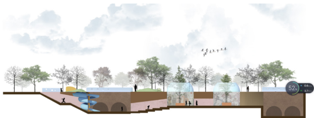
图 3 窑洞再设计

以完全废弃窑洞为基础，对其进行全方位的改造设计丰富空间层次，将窑洞文化和现代生活相结合。而对于半破损窑洞，可以对其进行空间重组，从而达到空间再利用，以此提升居民的生活环境和生活质量（见图 3）。