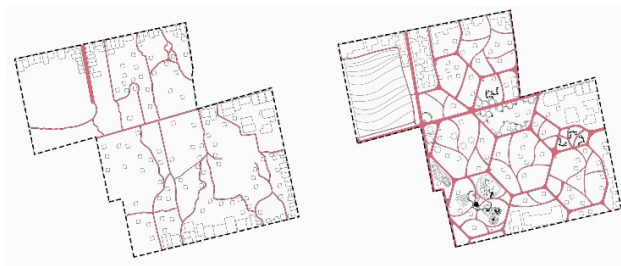
图 4 原村落道路系统和改造后的道路系统

村落道路的再规划设计主要分为三个级别，一级道路为东西向的主干道，二级道路为连接各个功能区六边形道路，三级则主要为村落内部满足交通需求。不同区域也在原有基础上整理并加以改造，整理原有废弃场地并加以改造，对不同场地进行不同程度的改造。保证在满足居民生活的前提下，结合当地的文化、环境特征，达到村落景观的提升。休闲区域主要以娱乐为主，将不同程度的废弃窑洞针对不同人群进行设计，在结合现代文化的同时也丰富了村落的空间层次（见图 4、图 5）。