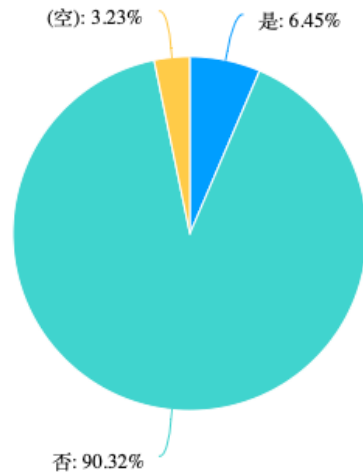
图 2 扈家村改造卫生厕所是否享受了政府的改厕补贴情况