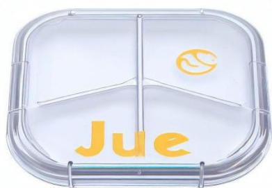
图 2.1 可循环餐盒设计图

可循环餐盒的价值在于它在生产、装食、运输、饮食和回收方面的便利性 [5] 。采用绿色环保密胺树脂作为材料的可循环餐盒, 具有轻巧、美观、简洁等多种优点, 方便顾客随时随地使用。如图 2.1 所示, 为了使绿色可循环餐盒具有更好的保温性能和密封性能, 采用了分层式结构, 将餐盒分成隔层, 以避免不同食品混淆, 同时也能够保证食品的温度。餐盒盖子在设计上, 具备一定的密封性能, 以防止食品的污染和泄漏。可循环餐盒整体设计结构轻巧, 方便用户使用, 同时也要考虑到用户的使用习惯和需求, 以提高餐盒的便利性。在回收方面, 可循环餐盒采用可回收的绿色环保材料制成, 可循环使用, 避免了一次性餐盒的浪费和对环境的负面影响。