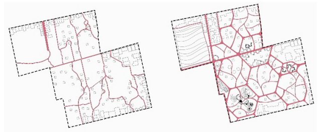
图 4 原村落道路系统和改造后的道路系统

村落道路的再规划设计主要分为三个级别，一级道路为东西向的主干道，二级道路为连接各个功能区六边形道路，三级则主要为村落内部满足交通需求。不同区域也在原有基础上整理并加以改造，整理原有废弃场地并加以改造，对不同场地进行不同程度的改造。保证在满足居民生活的前提下，结合当地的文化、环境特征，达到村落景观的提升。休闲区域主要以娱乐为主，将不同程度的废弃窑洞针对不同人群进行设计，在结合现代文化的同时也丰富了村落的空间层次（见图 4、图 5）。