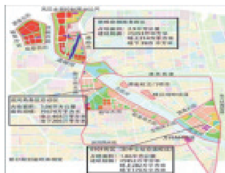
图1 运河商务区布局

运河商务区聚焦高端商务服务业, 重点培育发展金融服务和总部经济, 成为建设全球财富管理中心、北京绿色