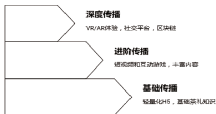
图2 茶礼圈层传播矩阵图

为应对数字鸿沟与包容性挑战，应构建茶礼文化传播的“梯度适配”的技术应用体系。基于不同区域的技术接入条件，开发从低带宽图文解析到高清互动模拟的多级茶礼数字产品矩阵，其中以轻量化 H5 交互模块作为基础传播载体，确保基础茶礼知识可被各类终端用户获取，实现文化传播的技术包容性。