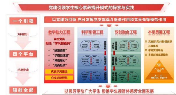
图1 党建引领学生核心素养提升模式图