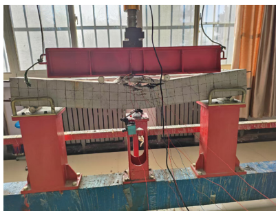
图1 钢筋混凝土受弯构件破坏试验

新编《混凝土结构设计原理》校本教材,结合 2024 版《混凝土结构设计标准》修订内容,开发“配筋率规定的安全逻辑”等 3 个教学案例,通过钢筋混凝土受弯构件破坏试验展示不同形式配筋梁的破坏过程(如图 2),直观展示《混凝土结构设计标准》中关于钢筋混凝土梁受弯构件配筋率方面规范条文的科学依据。