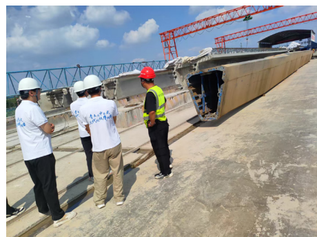
图2 带领学生参与暑期社会实践

在混凝土结构用材料的物理力学性能章节,通过详细介绍钢筋与混凝土的协同工作实现“1+1 > 2”的效果,引出团队合作的重要性 [11] ;采用 PBL 教学法组织学生设计钢筋混凝土受弯构件并进行破坏实验进行小组讨论、汇报、解答,并形成报告;依托学校周边在建 G244 线庆阳过境段公路工程项目,带领学生参与暑期社会实践项目了解钢筋骨架加工制作、混凝土现场浇筑、桥梁结构与施工等具体知识的应用;指导学生报名参加全国大学生结构设计竞赛等途径和方式,增强学生的专业认知和团队协作能力。