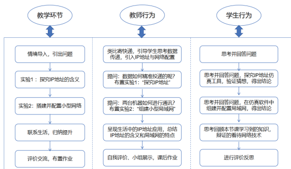
图1 “搭建并配置小型网络”教学设计流程图

本节课以“寄快递”生活情境导入，引导学生理解地址在信息传递中的作用，类比引出IP地址概念。教学主体分为两个递进式实验探究环节：一是“探究IP地址的组成”，学生通过仿真软件观察、修改IP地址，理解其命名规则与唯一性；二是“搭建并配置小型网络”，学生以“网络工程师”角色完成拓扑设计、设备连接与参数配置，并进行连通性测试。最后通过生活案例联系、小组汇报与多元评价，实现知识的迁移与内化。教学流程如图1所示。