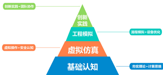
图2 四阶递进课程体系

型”“经济环保评价”等模块分解后精准对接到相应课程的教学与考核中，形成“主线项目”驱动的教学闭环。为保障体系的持续活力，建立常态化动态更新机制，依据产业新技术、竞赛新趋势与企业真实案例，持续迭代教学案例库、项目库与习题资源，确保教学内容始终与工程前沿同步演进。