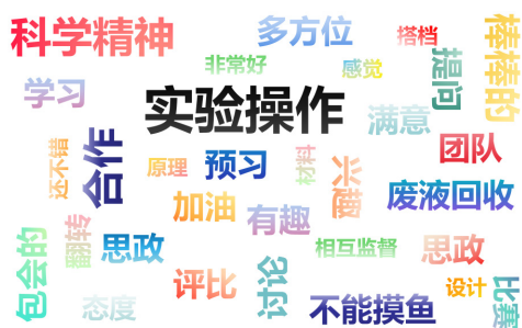
图3 学生对无机化学实验课程的关键词分析图

科学信仰、塑造严谨品格，完成了从知识接受者到价值认同者、未来建设者的第一次关键淬炼。与此同时，同行教师也认为，改革后的实验课堂“学术味”与“育人味”同频共振，学生参与度高，课堂氛围积极向上。