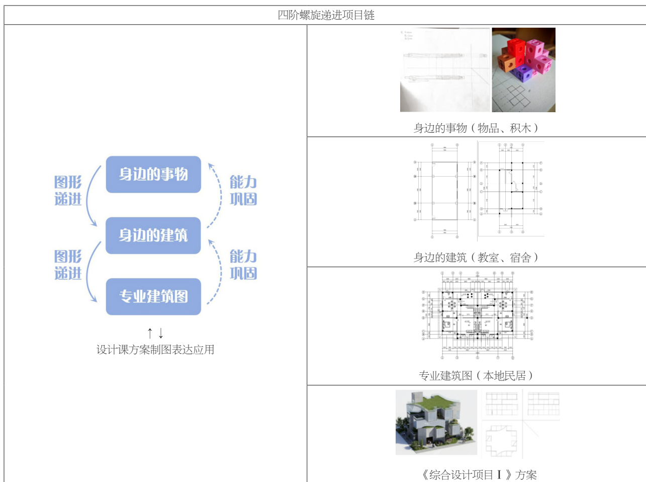
图1 四阶螺旋递进项目链