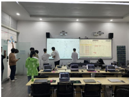
图3 师生共同测绘教室

双课联动机制：为根治“学用脱节”，《制图与识图》作为建筑类大一专业基础课程与下学期开展的基础设计课程《综合设计项目 I》进行了深度耦合的顶层设计。两门课程共享“螺旋递进”的逻辑，并在最终项目式教学内容上交汇：设计课产出空间的“躯体”（手工模型）+ 制图课锤炼表达的“语言”（标准图纸）。最终，学生将用一套高质量的、包含个人设计作品专业三视图的图纸，同时完成两门课程的顶层考核。这种“一体两面、成果共享”的联动机制，使学生深刻体会到制图不是孤立技能，而是设计思维不可或缺的组成部分，实现了学习动机与成效的根本性提升。