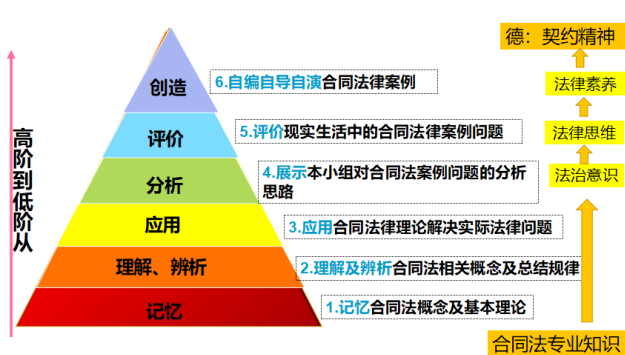
图 2 合同法章教学目标示意图

培养什么人、怎样培养人、为谁培养人是教育的根本问题，立德树人成效是检验高校一切工作的根本标准。落实立德树人根本任务，必须将价值塑造、知识传授和能力培养