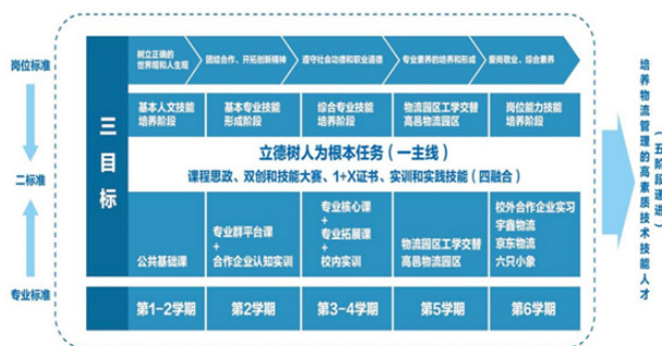
图 2 产教一体化实现路径

产教一体化人才培养模式遵循“一主线，二标准，三目标，四融合，五递进”路径。在整个人才培养过程中，“一主线”是坚持立德树人为主线，“二标准”指对接专业标准和岗位标准，“三目标”指知识目标、技能目标和素质目标相结合，“四融合”指在人才培养过程中，将课程思政、创新创业、岗课赛证、实训和实践环节融入日常教学中，“五递进”是遵循循序渐进的原则，知识、技能、素养实现五阶段的提升（见图 2）。