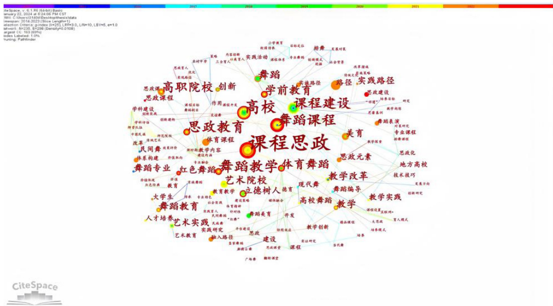
图 2 关键词共线图