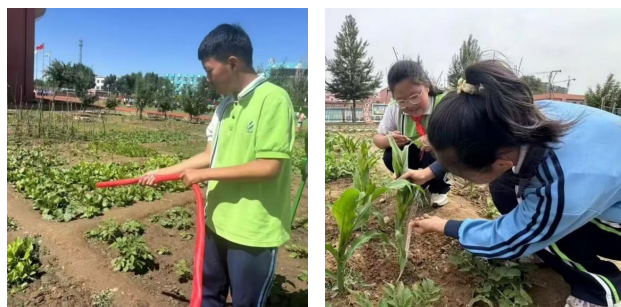
图 1 促进五育内容的有机融合与协同教学

在五育融合模式中，德育教育创新的一种有效途径是促进各育内容的有机融合与协同教学。学校应通过课程设计和课外活动，打破学科之间的界限，推动各学科内容的交叉整合，从而避免传统的学科孤立。德育教育不仅要与智育结合，还要充分融合体育、美育和劳育，提供多元化的教育体验（见图 1）。