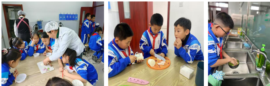
图 3 明确德育教育目标，构建科学的评价体系

冬至时，在劳动课上学校组织学生集体参与包饺子、做菜等活动。在活动过程中，学生不仅学会了如何切菜、洗菜、包饺子，还通过团队合作增进了彼此的沟通与协作。这一过程体现了德育教育中的责任感培养，每个学生都需分担工作，互相帮助，确保活动顺利进行。同时，学生通过实际动手操作，体验到劳动的价值，理解了“团结合作、尊重他人”的道德意义（见图 3）。