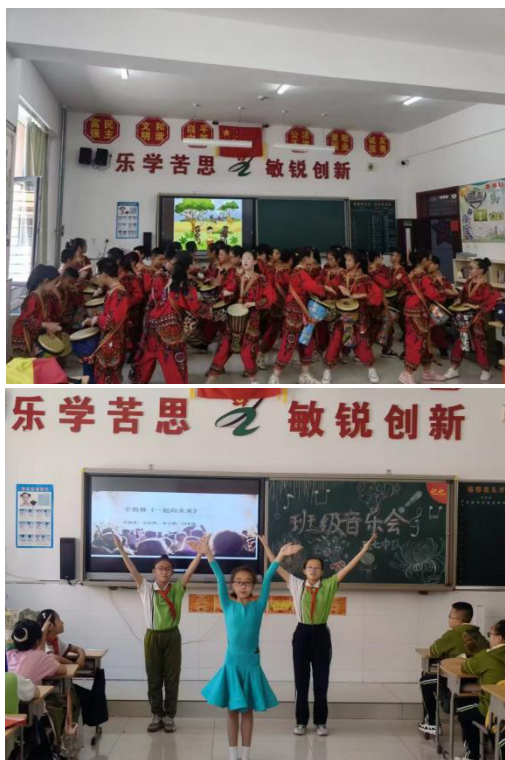
图 5 将德育教育与学生生活实践紧密结合

这种活动不仅增强了学生的艺术感知和表现力，也锻炼了他们的责任感与集体意识。通过实践，学生们理解到道德行为并非抽象的理论，而是体现在日常生活中的具体行动。比如，在演出筹备期间，大家共同讨论如何提高团队协作效率、如何解决排练中的问题，体现了德育和智育的结合。这种活动不仅增强了学生的道德认同，也帮助他们将道德理念落实到生活中，从而实现德育教育的有效促进。