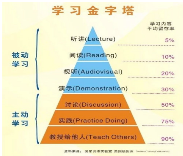
图 2 提升学习效率的好方法

在课外活动中，学校组织学生参与环保项目，像是校园绿化活动和爱护花草的实践。通过修剪草木、浇水、种植花卉等活动，学生不仅在劳动中锻炼了身体，培养了集体主义精神，还通过亲手照料植物感受到环境保护的重要性。这些活动在潜移默化中锻炼了学生的责任感与团队协作意识，体现了德育与智育的结合。学生们通过实际行动理解到保护环境不仅是道德责任，也能提升自己的综合素质，如观察植物生长、了解生态循环等，提高了他们的科学素养（见图 2）。