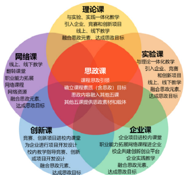
图 3 思政元素汲取源头

依据知识点分层的结果编写思政教学大纲。如图 3 所示, 明确各章节思政元素的来源。在讲电路元件时, 不能只让学生知道元件的功能和特性, 还要引导他们了解元件研发过程中的创新精神和工匠精神。在介绍电路分析方法时, 要培养学生严谨的科学态度和解决实际问题的能力。要把思政目标融入教学大纲, 保证思政教育在教学过程中是系统且连贯的。