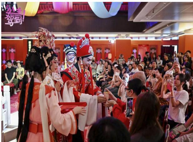
图2-1 《公主驾到!》现场演出互动场景