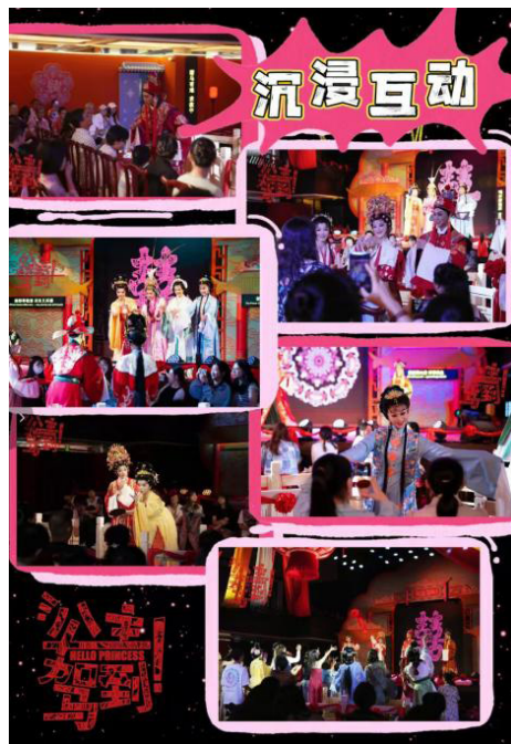
图4-1《公主驾到!》互动场景

在互动体验型产品的构建上,《公主驾到!》形成了可复制的创新范式。其一,通过金枝席的身份分层设计,将观众从旁观者转化为剧情参与者,有效解决了传统戏曲观众置身事外的痛点。其二,借助盲盒式观演机制制造新鲜感与悬念,让每次观演都成为独特的体验,从而激发观众的复购意愿。其三,以沉浸式空间改造消解舞台边界,使剧场本身成为叙事的有机组成部分 [17] 。三者的叠加效应,使传统粤剧完成了一次形态跃迁,从单向度的舞台艺术作品,升级为集参与性、互动性、复购性于一体的文旅体验产品,如图4-1示。