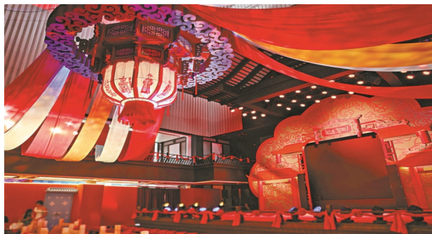
图2-2 《公主驾到!》现场舞台

在舞台空间设计方面,其突破了传统戏曲“镜框式舞台”的表演模式,演出通过沉浸式场景设计,将演出空间与观众活动空间相结合。例如利用广府建筑风格的园林环境进行改造,将部分空间设置为“公主闺房”并将中心区域布置为婚礼场景,使观众在进入演出空间后仿佛置身于真实的广府婚礼环境之中。在演出过程中,演员在观众间穿行表演,模糊表演区与观演区界限,让观众完全置身于剧情场景之中,强化临场感与代入感,也使传统戏曲获得新的舞台表现形式,如图2-2所示。胡志毅在《戏剧的“沉浸式”转向:从舞台到空间》中提出,戏剧空间的革新本质是“将舞台从封闭的表演容器转化为开放的体验场域” [7] ,这一观点精准概括了本剧舞台设计的核心逻辑,为传统戏曲的空间活化提供了实践样本。