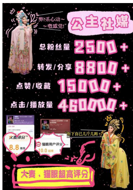
图3-1 《公主驾到!》传播数据图

从传播数据来看,该剧在抖音官方账号发布的视频内容,其点赞量、评论量、分享量均未形成现象级传播效应,如图3-1所示。相较于近年来破圈的戏曲作品,如粤剧电影《白蛇传·情》全网播放量过亿 [10] 、《决战天策府》微博话题阅读量近9000万 [11] ,而《公主驾到!》的传播效能仍有较大差距,反映出其尚未突破圈层壁垒,实现跨区域、跨代际的广泛传播。