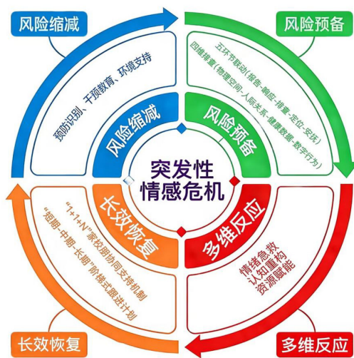
图2 学生突发性情感危机4R工作法循环图

立足育人工作实际，系统复盘本案例的处置全过程、提炼固化心理干预的有效经验，形成大学生突发性情感危机 4R 工作法循环图，同时将工作内容精心打磨为典型经验材料，为同类问题的科学处置提供专业参考。