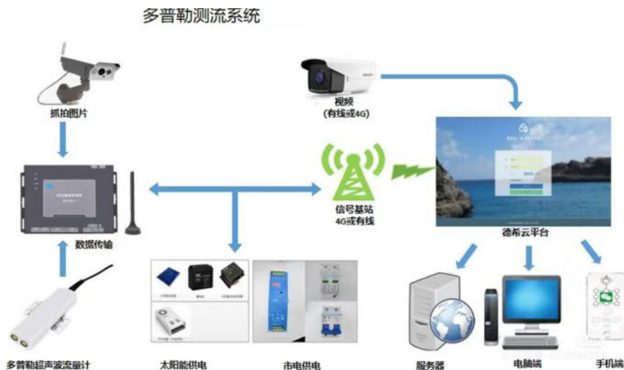
图 2 多普勒测流系统