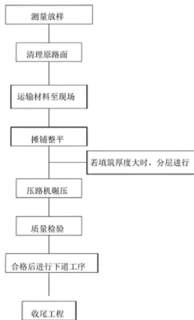
图 1 砂垫层法施工工艺流程图

需要在地表面进行挖槽，排出地表水，减少软土地基中的含水量，保证道路与桥梁在地表中进行施工。为了更好地对挖槽进行挖掘，施工人员在回填过程中选择吸水性较小的碎石或者砂砾进行回填，同时为排水槽进行加固。然后是砂垫层法（见图 1），这种方式适用于软土层较薄、排水性较强的软土地基进行处理，在处理过程中将砂垫层铺设高于 13cm 以上，并且提高软土地基的排水层，使软土地基在构造物荷载过程中加快排水固结的凝结程度，保证软土地基的稳定性。所以在砂砾垫层材料中，以粗砂或者 5cm 以下的砂砾为主。在软土层上方进行砂垫层的铺设，并在铺设过程中洒水对砂垫层压实，不断对砂垫层进行加固，保证软土地基的固结。其次，利用敷垫材料对软土地基进行填充，在遇到地基土层出现不均匀下沉过程中，利用敷垫材料进行填充，如化纤无纺布、玻璃纤维等材料，利用材料的抗剪力与抗拉力加固道路与桥梁路基的坚固度。最后，对软土地基加入添加剂，在表层主要为黏性土的地基，可以在软土地基中加入石灰、水泥等材料，提高软土地基的压缩性。同时以混凝土材料与软土进行搅拌，保证混凝土与软土进行结合，提高软土的固结力，保证软土路基的稳定性。