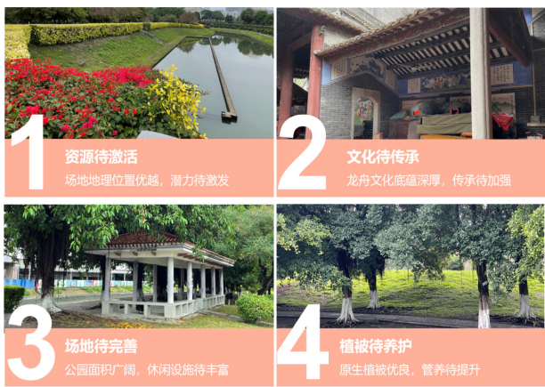
图1 口袋公园场地现状