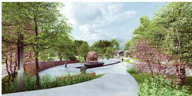
图2 舟头擂鼓节点效果图

环境提升的核心目标，是打造舒适宜人、贴合龙舟文化主题的公共休闲空间，设计充分利用场地原有自然景观条件，保留了场地原有蜿蜒的水系和茂密的原生植被，打造生态友好的休闲空间，没有对原有自然地貌做大规模的改动。在保留原生景观的基础上，添加大量和龙舟文化相关的景观细节，比如龙舟造型的休憩长椅、印有鼓点图案的地面铺装、展现龙舟精神的主题雕塑，让整个公园的各个角落都能体现文化主题，形成沉浸式的文化体验空间。针对核心文化节点，设计添加了景观照明和声音装置，还原龙舟竞渡的热烈氛围，让访客不管什么时段到访，都能感受到龙舟文化的感染力。核心节点用曲线线条呼应场地原有水系的形态，船型置石搭配鼓雕塑还原鼓手擂鼓的竞渡场景，景墙书写龙舟文化的千年发展历史，让节点同时具备观赏和文化传播功能（如图2所示） [5] 。